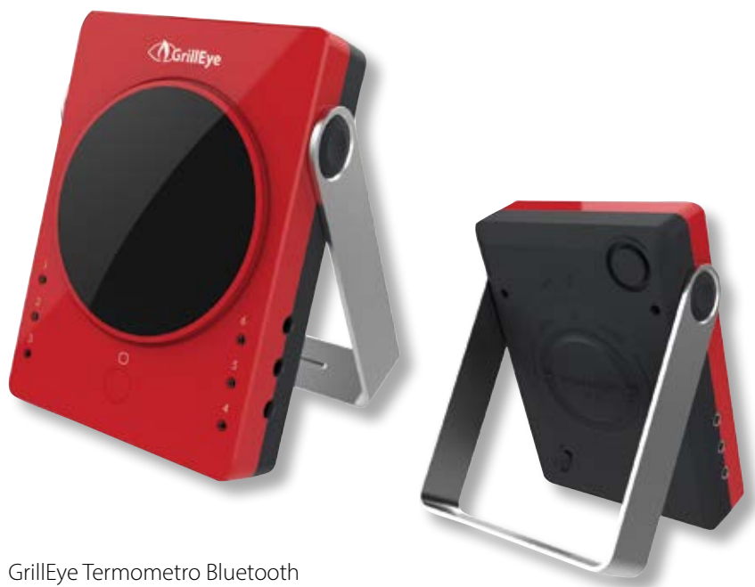
GrillEye Termometro Bluetooth GE BT