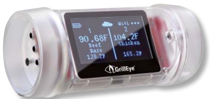
GrillEye Termometro Max GE MAX