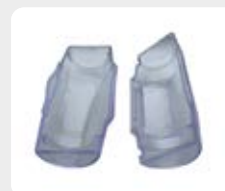
Grilleye WaterProof Case GE WPC