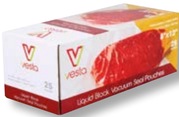
Confezione 25 sacchetti per liquidi VST 108111