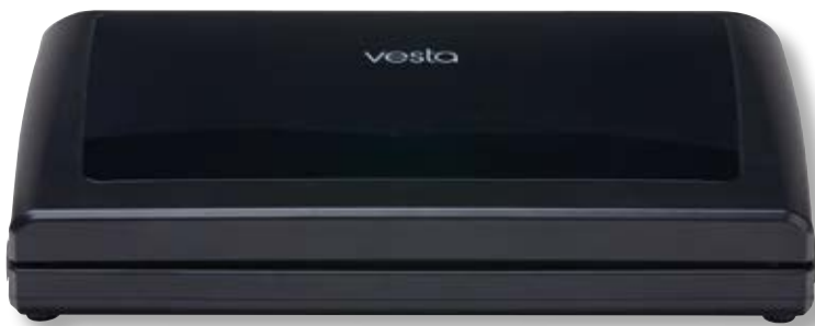
Barra per sottovuoto VST V11 BK