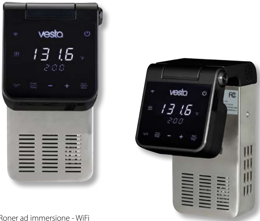
Roner ad immersione - WiFi VST SV81 BK