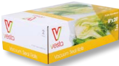
Confezione 2 rotoli VST 101211