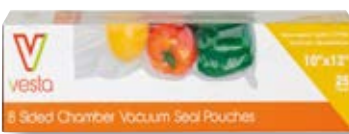
Confezione 25 sacchetti VST 208103