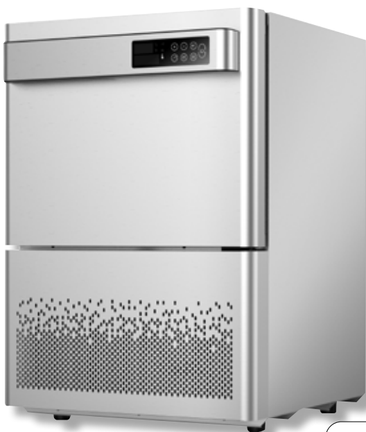
Abbattitore VST BF100 SS