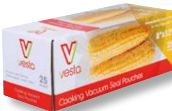
Confezione 25 sacchetti VST 109112