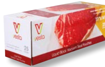
Confezione 25 sacchetti per liquidi VST 108112