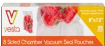
Confezione 25 sacchetti VST 208102