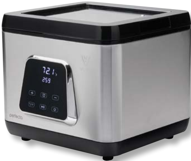
Vasca cottura sottovuoto - WiFi