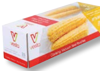
Confezione 25 sacchetti VST 109113