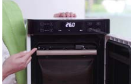
Campana per sottovuoto verticale VST V40 BK