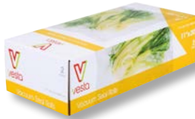
Confezione 2 rotoli VST 101212