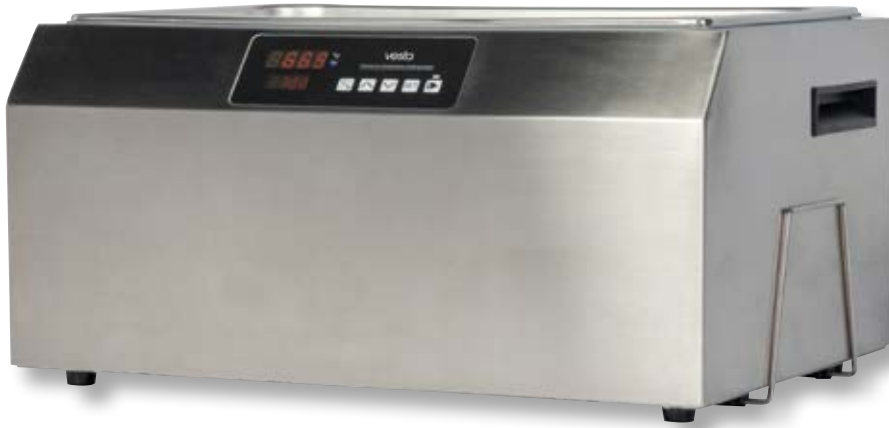
Vasca cottura sottovuoto VST SV251