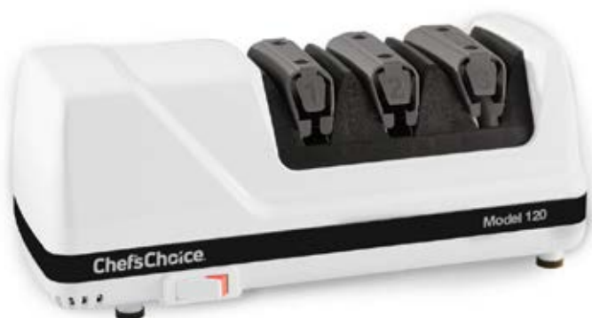
Diamond Hone® EdgeSelect® CC 120