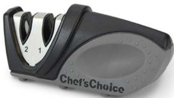
Sharpener Compatto CC 476