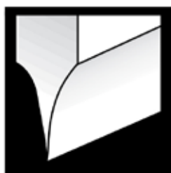
Conventional Hollow-Ground Edge