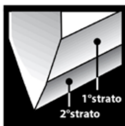
Chef'sChoice® Dizer® Engineered