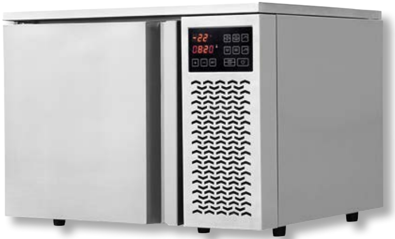
Abbattitore VST BF200 SS