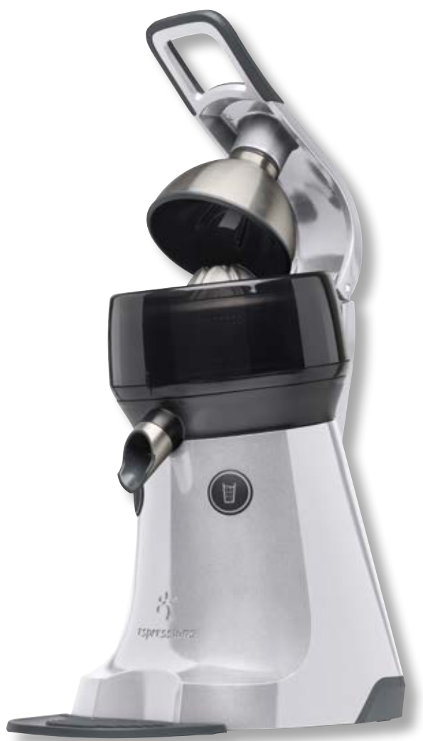
The Juicer ESP EP7000 SV