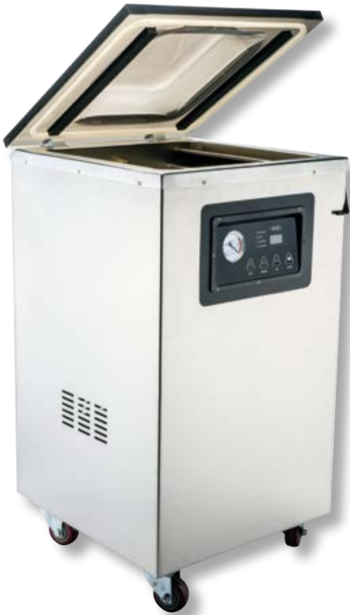
Campana alta per sottovuoto a pompa d'olio