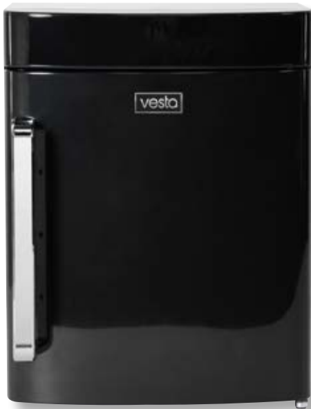
Campana per sottovuoto verticale VST V40 BK