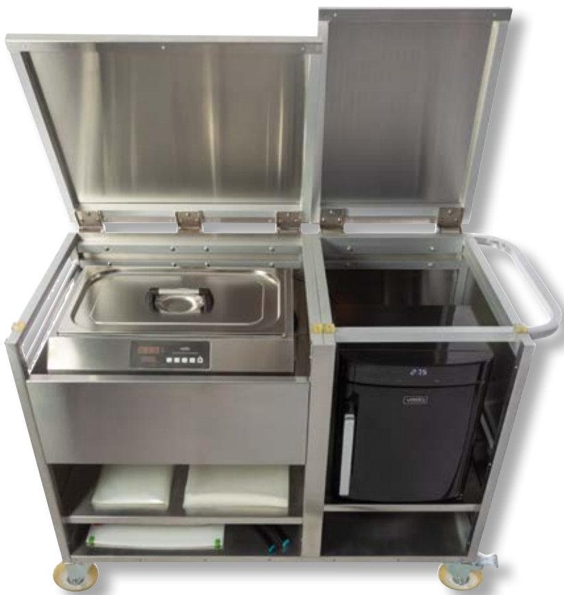
Stazione mobile sousvide