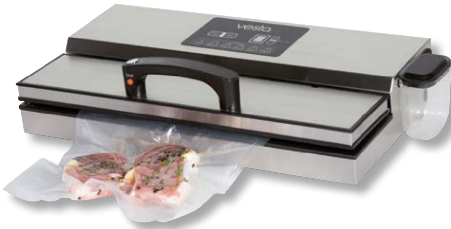
Barra per sottovuoto VST YJS781C