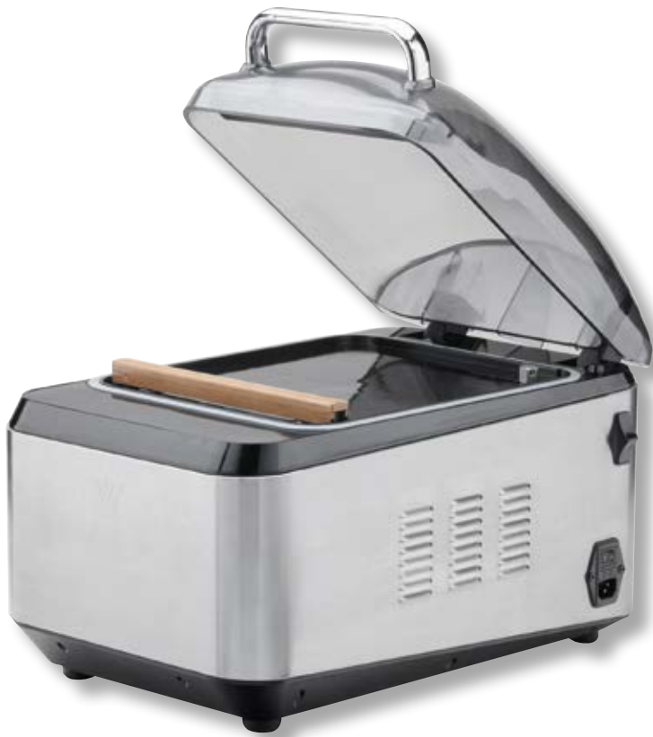
Campana per sottovuoto ad aria