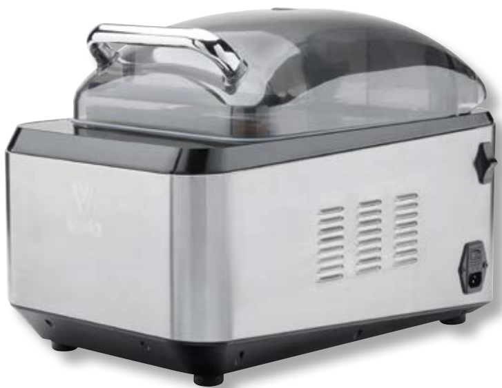
Campana per sottovuoto ad olio