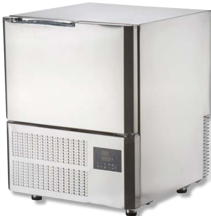
Abbattitore VST BF300 SS

FOOD CENTER TEMPERATURE da + 90°C a +3°C: Raffreddamento x 7 kg di alimenti: 90 min. FOOD CENTER TEMPERATURE da + 90°C a -18°C: Congelamento x 4 kg di alimenti: 240 min.