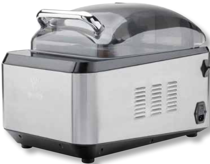
Campana per sottovuoto ad olio