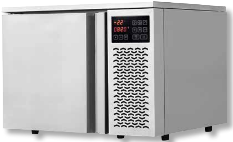
Abbattitore VST BF200 SS