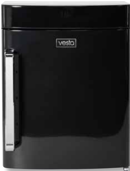
Campana per sottovuoto verticale VST V40 BK