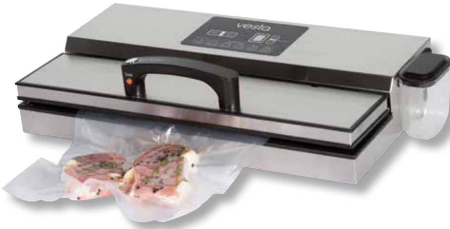
Barra per sottovuoto VST YJS781C