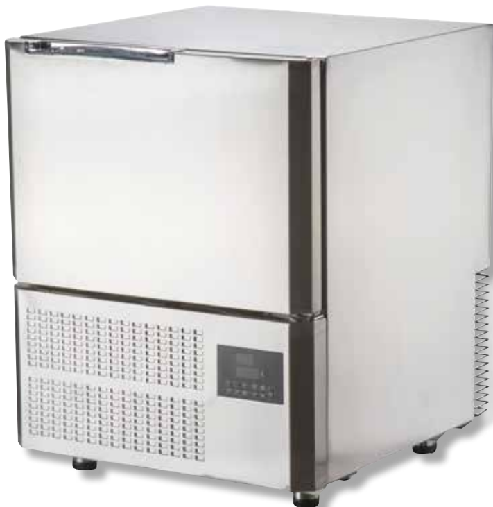
Abbattitore VST BF300 SS

Congelamento x 4 kg di alimenti: 240 min.