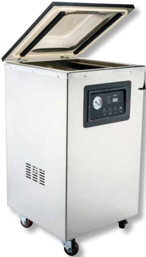
Campana alta per sottovuoto a pompa d'olio