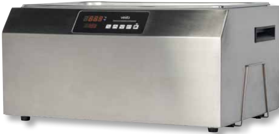
Vasca cottura sottovuoto VST SV251