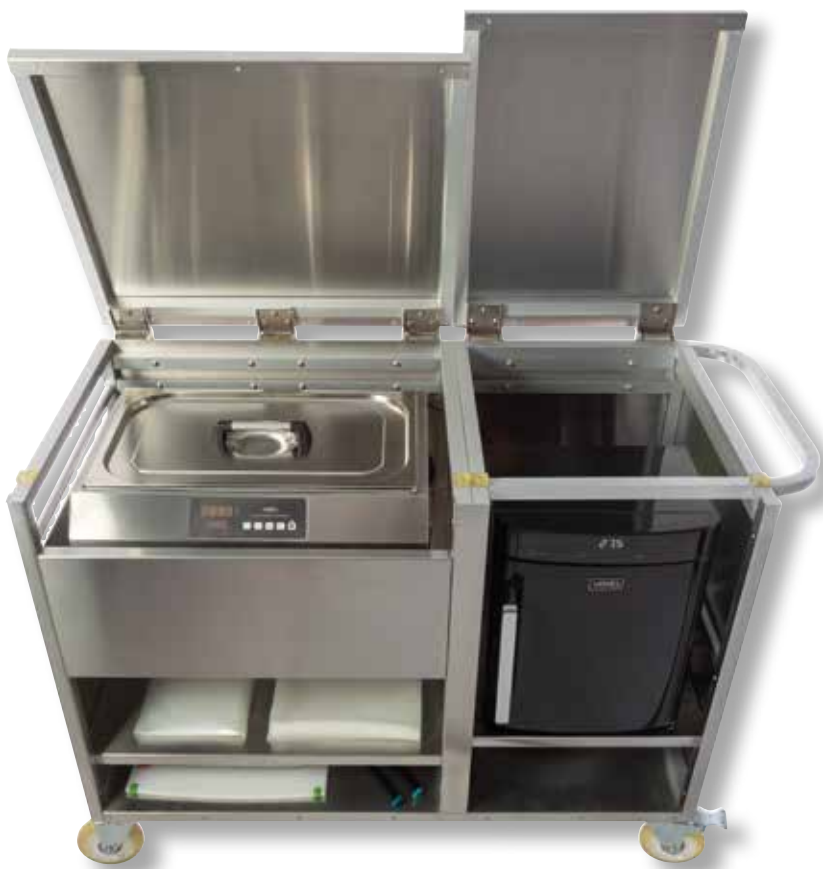
Stazione mobile sousvide